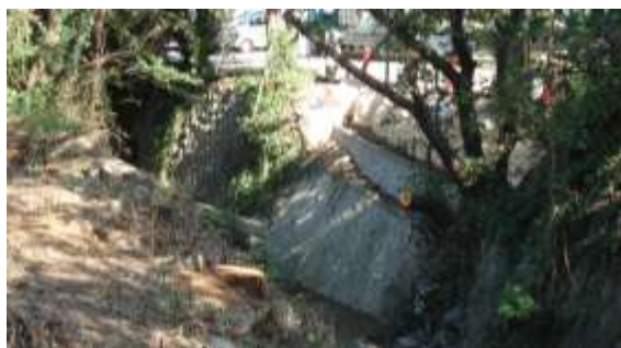
倉治7丁目、がらと川護岸崩壊の復旧工事中