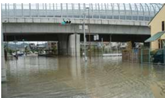
第2京阪道路と市道私部西線の交差付近

京阪電車・JRの線路が冠水したために、電車がストップしました。一時はふみきりが動かず、交通渋滞になりました。 学校校舎では、交野小・星田小・岩船小で教室一部浸水、長宝寺小・私市小・2中で体育館の雨漏りがありました。