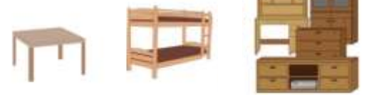
有料と指定されているもの (46品目)